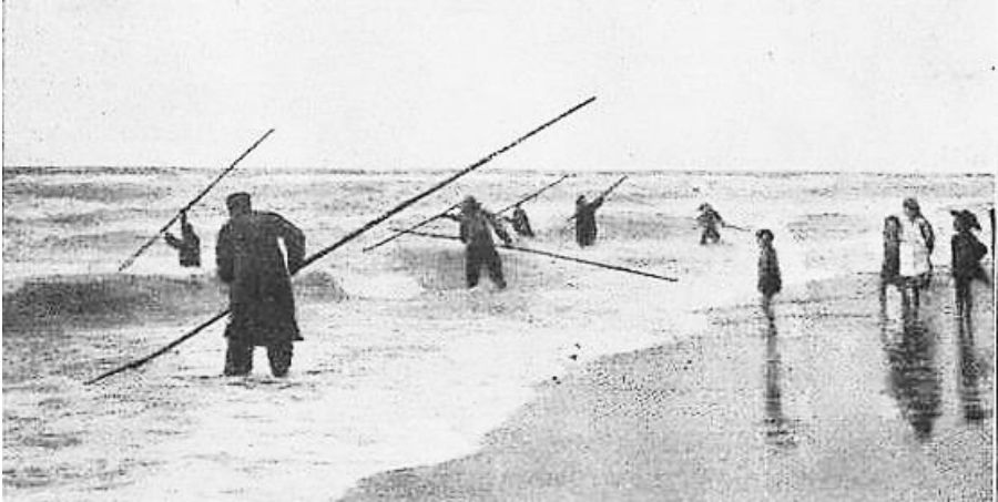
Afb. 3. Barnsteenvissers, circa 1912-1922.

uitdregging behoeft, zouden diephouden en bovendien een dagelijksch pachtgeld van 25 thaler zouden betalen. Dat het contract niet onvoordelig voor hen was, blijkt uit het feit, dat zij, toen de zes jaren waarvoor het was afgesloten om waren, tweehonderd thaler per dag aanboden in plaats van vijf-en-twintig. De barnsteenopbrengst te Schwarzert wordt geschat op 75.000 pond in't werkjaar van omstreeks dertig weken.