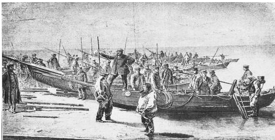
Afb. 4. Barnsteenvissersboten, 1869.

De visschers blijven vijf uur per dag onder water, en ofschoon de zee in de herfst ijskoud is, is het werk, dat zij te doen hebben zoo zwaar, dat zij in't zweet badend weder aan de opervlakte komen.